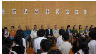
むかしあそび名人の方々

また、10月23日(火)と26日(金)には、下学年・上学年ごとの合同音楽を行い、11月22日に行う全校合唱の練習をたくさんの方に参観をしていただきました。大会当日は、是非、本番の700人による全校合唱をご鑑賞いただければと思います。