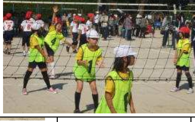
10/21 広島市少年少女バレーボール大会