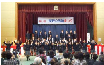
10/28 東野公民館祭・合唱団 出演