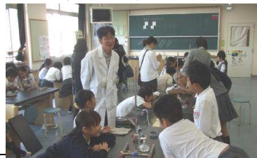
10/24 小中連携 公開授業研究会(4年生)